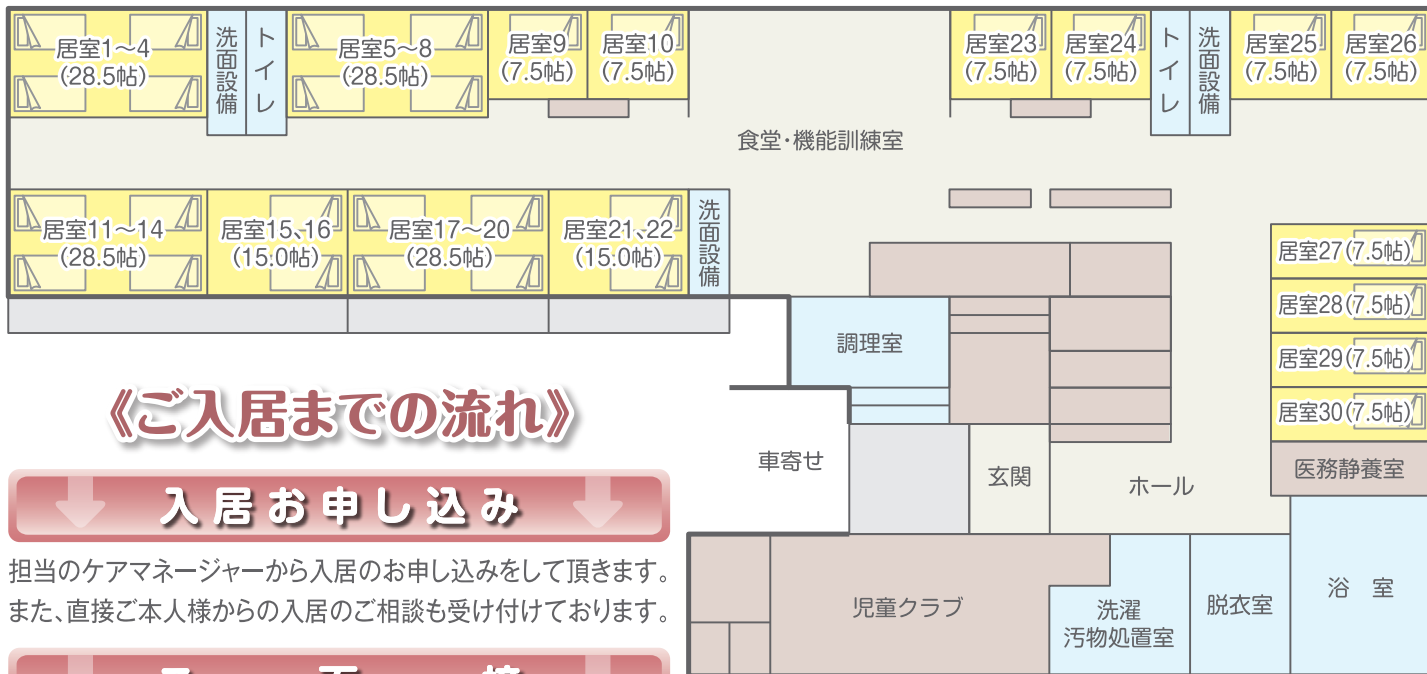
▲ 施設間取りイメージ